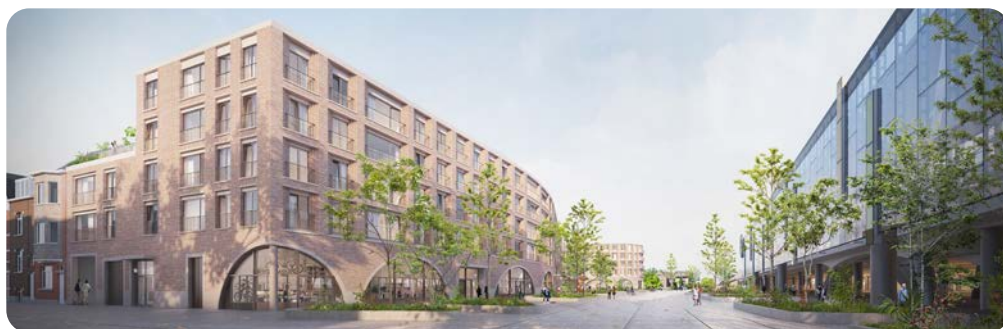
De baksteenarchitectuur verwijst naar het historische stationsgebouw en de bestaande spoorwegtaluds in de Sint-Denijslaan*

Op het dak van het gebouw komen publiek toegankelijke daktuinen waar de buurtbewoners aan stadslandbouw kunnen doen. Tussen de bestaande woningen en het nieuwe gebouw in wordt een collectieve binnentuin voorzien met ruimte op volle grond voor aanplanting van bomen en struiken. De buurtbewoners zullen actief betrokken worden bij de invulling hiervan. Ook over de doorsteek van de Reigerstraat naar het plein wordt nog verder samen nagedacht.