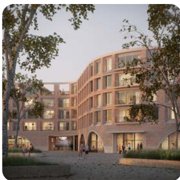
Detail van het S-gebouw*

In juli 2021 hebben het stadsontwikkelingsbedrijf sogent en de private partner Acasa Group een samenwerkingsovereenkomst ondertekend voor de ontwikkeling van het nieuwe S-vormige gebouw op het Koningin Mathildeplein. Het gebouw krijgt een gemengde invulling met 63 budget-huurwoningen, een collectieve binnentuin, een hostel en publiek toegankelijke daktuinen voor stadslandbouw.