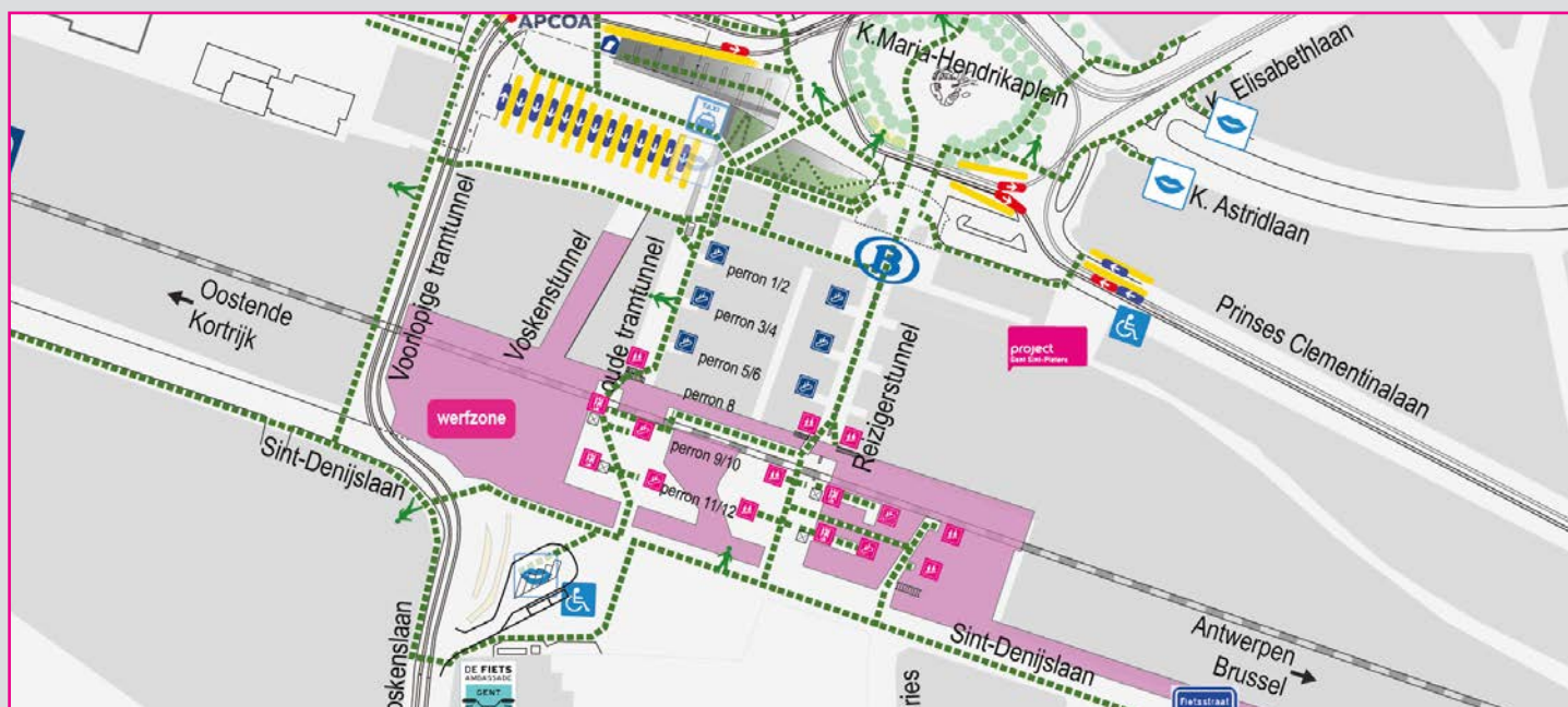
V.U. Mathias De Clercq, voorzitter Stuurgroep, p/a Stadhuis, Botermarkt 1, 9000 Gent

Op onderstaande kaart staan de werfzone (roze) en looplijnen (groen) aangeduid. Meer informatie over de werf vind je steeds op onze site www.projectgentsintpieters.be .