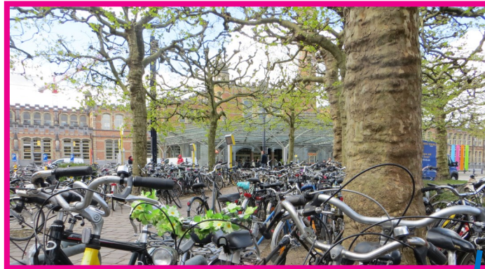
Fietsenstalling Koningin Maria Hendrikaplein