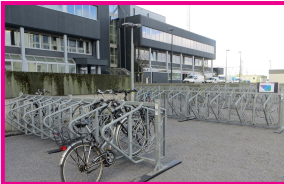
Fietsenstalling seinhuis (achter het VAC)