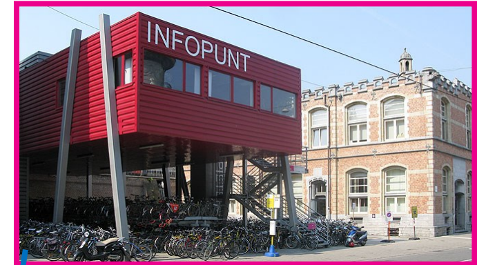
Fietsenstalling Prinses Clementinalaan