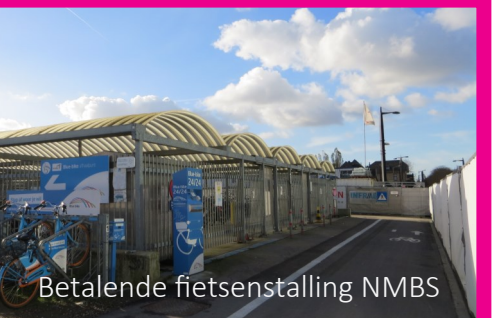
Betalende fietsenstalling NMBS