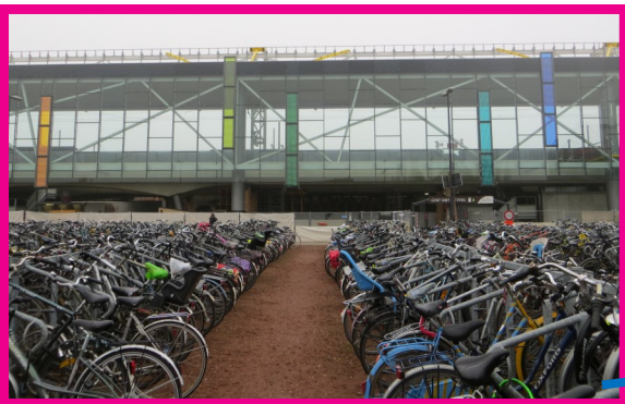
Fietsenstalling Koningin Mathildeplein