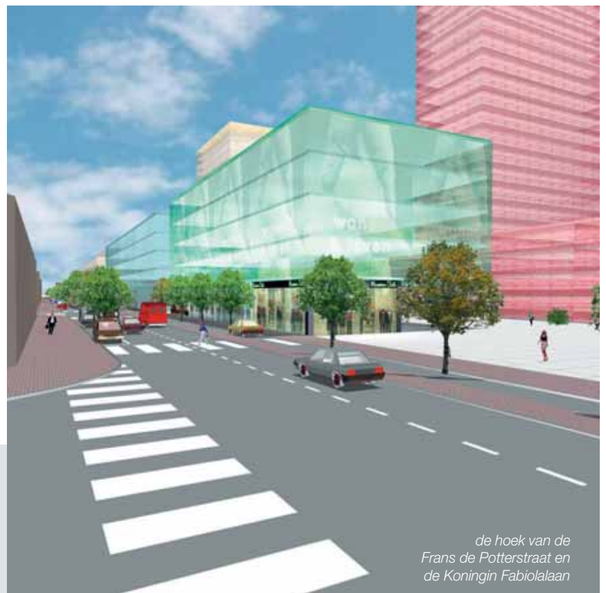
de hoek van de Frans de Potterstraat en de Koningin Fabiolalaan

De onmiddellijke omgeving van het station wordt omgevormd tot