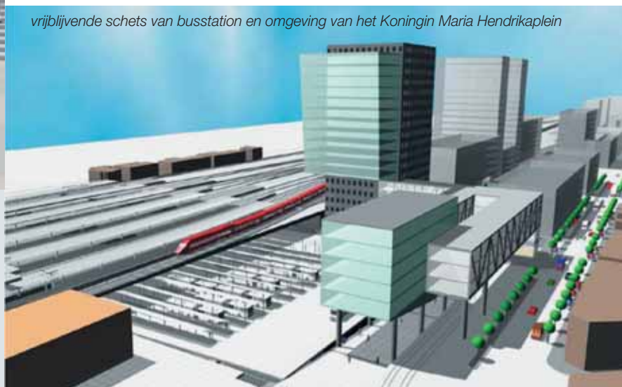
vrijblijvende schets van busstation en omgeving van het Koningin Maria Hendrikaplein

Waar vandaag nog het postgebouw staat, komt een gloednieuw busstation. Het busstation met 12 perrons zal plaats bieden aan 24 gelede bussen. Het is zo ontworpen dat overstappen op trams en treinen snel en comfortabel kan.