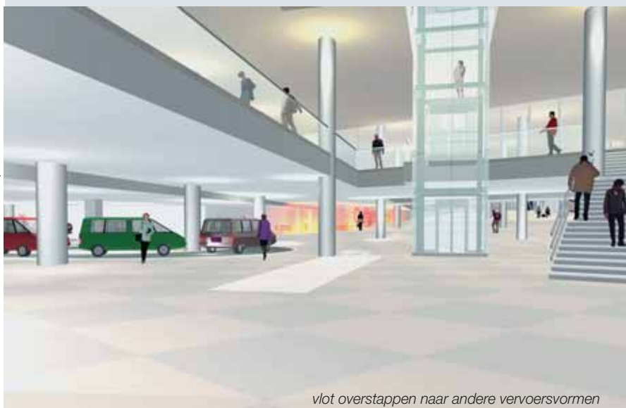
vlot overstappen naar andere vervoersvormen

Aan het beschermde stationsgebouw en de bomen op het Koningin Maria Hendrikaplein wordt niet geraakt in het ontwerp van architect Jacques Voncke (Eurostation). Tussen het stationsgebouw en de Sint-Denijslaan komt een open hal onder de spoorlijnen. Van daaruit kan de reiziger zich met roltrappen en liften naar de nieuwe brede perrons begeven. In de grote hal komt een open ruimte met allerlei faciliteiten, horecazaken en winkels. De smalle ingang aan de Sint-Denijslaan verdwijnt en wordt vervangen door een volwaardige ingang met een eigen gezicht en stationsplein. Over de nieuwe perrons komt één groot dak dat voor een betere beschutting zorgt. De huidige open parking naast het station verhuist naar de ondergrond.