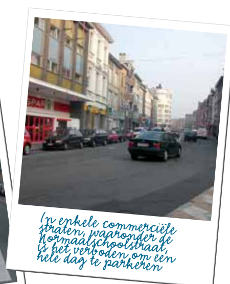
In enkele commerciële straten, waaronder de Normaalschoolstraat, is het verboden om een hele dag te parkeren