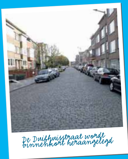
De Duifhuisstraat wordt binnenkort heraangelegd

Een kwaliteitsvolle invulling van het publiek domein blijft de prioriteit van het stadsbestuur. Centraal in het beleid staan kwaliteitsvolle aanleg en onderhoud van straten, paden, pleinen, fietspaden en trottoirs. Daarnaast wordt er ook in de Stationsbuurt Noord in het bijzonder gelet op de openbare verlichting, het straatmeubilair en het publiek sanitair.