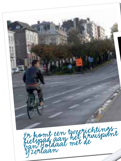
Er komt een tweerichtingsfietspad aan het kruispunt van Holdaal met de Yzerlaan