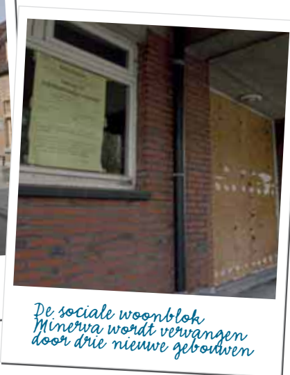
De sociale woonblok Minerva wordt vervangen door drie nieuwe gebouwen