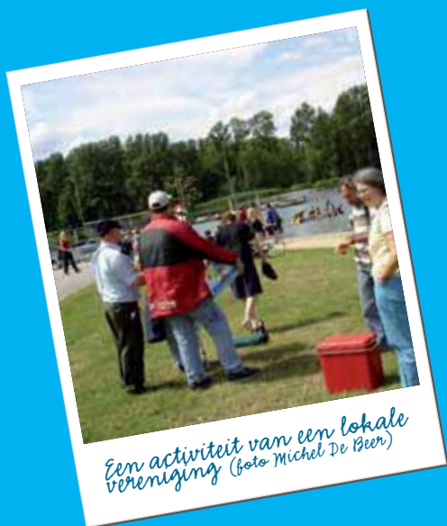
Een activiteit van een lokale vereniging

• Samen met de universiteit werkt de Stad aan beperking van overlast door studenten. In dit overleg wordt vooral aan preventie gewerkt. Daarnaast patrouilleert de politie elke woensdag-, donderdag- en vrijdagnacht in de "studentenbuurt" rond de Zwijnaardsesteenweg-Stropkaai. Op die manier probeert ze overlast door studenten zoveel mogelijk te beperken.