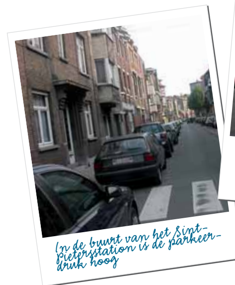
In de buurt van het Sint-pietersstation is de parkeerdruk hoog

• In het kader van het Project Gent Sint-Pieters is een ondergrondse parking voor 2810 wagens voorzien.