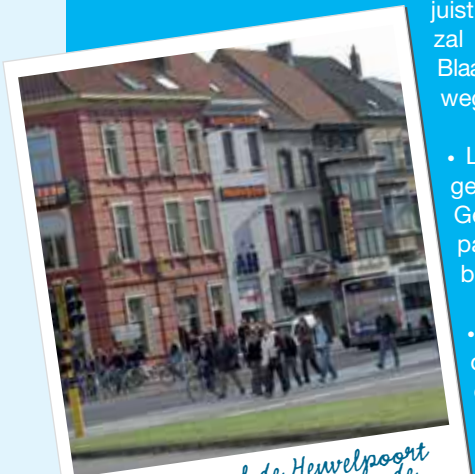
In 2007 zal de Herwelpoort worden heringericht om de veiligheid te verhogen

• Elke vervoersmodus heeft zijn plaats in de stad. Waar dit kan, krijgen voetgangers, fietsers en openbaar vervoer wel voorrang. Invoeren van eenrichtingsverkeer heeft enkele voordelen, zoals meer ruimte, bvb voor fietspaden. Er zijn echter ook nadelen aan verbonden. Zo moeten buurtbewoners vaak vrij ver rondrijden. Dit moet telkens goed bestudeerd worden en goed overlegd met de buurtbewoners.