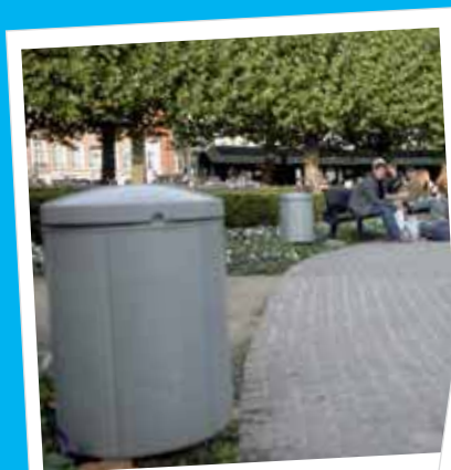
Eind 2005 werden nieuwe afvalkorven geplaatst op het Koningsin Maria Hendrikaplein

Eén derde van de sluisstorters wordt geïdentificeerd! Zij worden effectief vervolgd door het parket, dat uitspraak doet via themazittingen 'sluisstorten'. De Stad onderzoekt nog welke sanctiëring mogelijk is op private terreinen.