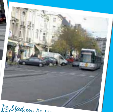
De Stad en De Lijn onderzoeken hoe de doorstroming van het openbaar vervoer tussen het station en het centrum verbeterd kan worden