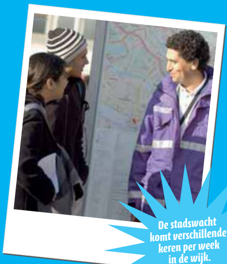
De stadswacht komt verschillende keren per week in de wijk.