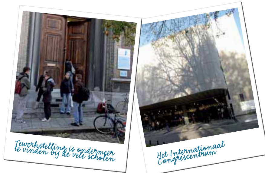
Tewerkstelling is ondermeer te vinden bij de vele scholen