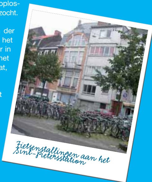
Fietsenstallingen aan het Sint-Pietersstation

• In het kader van het Project Gent Sint-Pieters zijn nieuwe fietsenstallingen voorzien (6800 overdekte plaatsen). De huidige bewaakte fietsenstalling aan het Sint-Pietersstation verhuist naar het braakliggende terrein in de Sint-Denijslaan (aan de achterzijde van het station) en gaat opnieuw open tegen begin 2007.