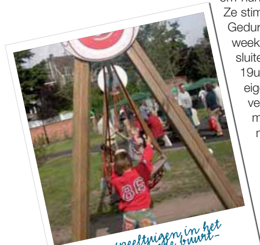
Er zijn speeltuigen in het recent aangelegde buurt-parkje in de Lucas De Heerestraat

Ze stimuleren de sociale contacten in de wijk. Gedurende één of twee weken of een aantal weekends kan men dan een straat laten afsluiten voor verkeer, en dit telkens van 14u tot 19u. Zo kunnen kinderen heel veilig in hun eigen straat spelen. Voorwaarde is dat dit verkeerstechnisch mogelijk is: de doorstroming van het verkeer in de buurt moet mogelijk blijven. In 2006 kregen de Distelstraat, de Duifhuisstraat en Holdaal het statuut van speelstraat. De komende jaren worden de speelstraten verder gepromoot.