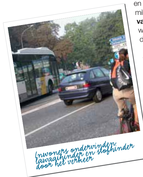
Inwoners ondervinden lawaaihinder en stofhinder door het verkeer