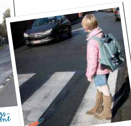
In de Stropstraat werden in de nabijheid van de basisschool nieuwe zebrapaden aangelegd

"Meer veiligheid voor fietsers en voetgangers"