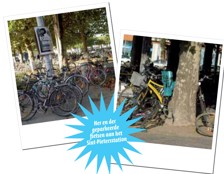
Her en der geparkeerde fietsen aan het Sint-Pietersstation