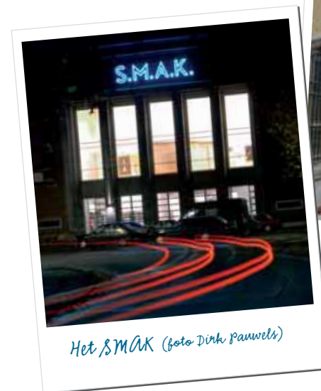
Het SMAK