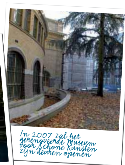
In 2007 zal het gerenoveerde Museum voor Schone Kunsten zijn deuren openen