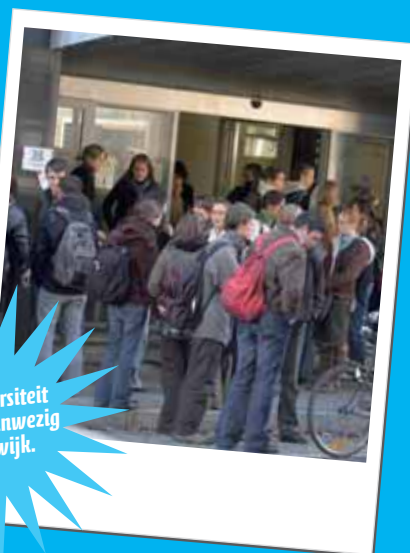
De Universiteit Gent is aanwezig in de wijk.

Daarnaast hechten de Stad en het OCMW belang aan de vlotte bereikbaarheid van de voorzieningen. Daarom voorziet de Stad in de Stationsbuurt Noord een aantal dienstverleningen op wijkniveau.