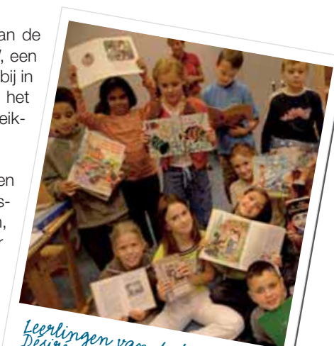
Leerlingen van de basisschool Desire van Monckhoven

• Twee straathoekwerkers werken sinds 2000 met de jongensprostitués door hen te informeren, door preventieve acties en door hen te begeleiden bij het zoeken naar werk, een woning... Zij werken vooral in het Citadelpark, maar ook in de buurt van het Sint-Pietersstation.