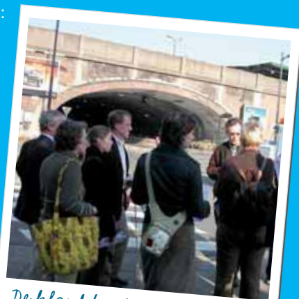
De klankbordgroep voor het Project Gent Sint-Pieters tijdens een wandeling op de site

• De Gebiedsgerichte Werking geeft de buurt informatie over het totaalbeeld van de projecten, acties en plannen van de stad. Hiervoor organiseert de Stad tentoonstellingen, debatten... (meer info: zie vooraan) en werkt de Gebiedsgerichte Werking sinds