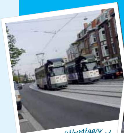
De Koning Albertlaan werd recent heraangelegd met een aparte bedding voor openbaar vervoer

• De Stad en De Lijn onderzoeken hoe de doorstroming van het openbaar vervoer tussen het station Gent-Sint-Pieters en de Kouter kan verbeterd worden. Daarbij zal in elk geval de Kortrijksesteenweg (tussen de Kortrijksepoort en de Elisabethlaan) onder handen worden genomen. In het kader van deze werken kan de veiligheid van de halte aan het lyceum worden verbeterd.