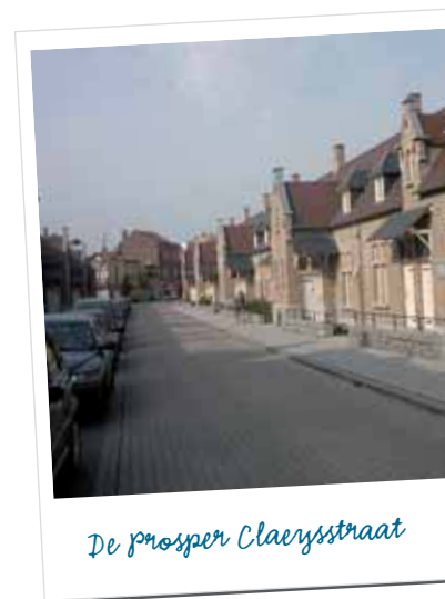
De prosper Claerysstraat

• De Goede Werkmanswoning vervangt de sociale woonblok Minerva in de Verpleegstersstraat door drie nieuwe gebouwen. In de plaats van de 100 bestaande woningen komen twee gebouwen met in het totaal 48 huurwoningen en één gebouw met 24 koopappartementen. Er wordt daarbij voor parkeerplaatsen en groen gezorgd. De afbraakwerken en de nieuwbouw zullen samen ongeveer twee jaar duren.