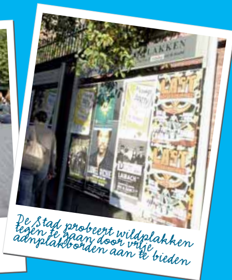
De Stad probeert wildplakken tegen te gaan door vrije adnplakborden aan te bieden