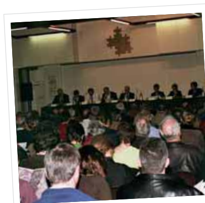
Op 28 april 2006 was er een wijkdebat met het college van burgemeester en schepenen en de inwoners van de stationsbuurten

• De Stad wil met het wijkbudget inwoners zelf initiatieven laten nemen om acties te organiseren. Die acties moeten de leefbaarheid, het samenleven, de inspraak en de communicatie in de wijk of deelgemeente verbeteren. Het college van burgemeester en schepenen verleent jaarlijks een budget per wijk of deelgemeente. Van dat budget kan een bewonersgroep minimum 500 euro en maximum 2500 euro steun aanvragen per initiatief per wijk. De actie moet een meerwaarde hebben voor de wijk of deelgemeente. Acties mogen niet privé-, partijpolitiek- of commercieel gebonden zijn. De Gebiedsgerichte Werking draagt een jury voor. De jury bestaat evenredig uit verenigingen uit de wijk, bewoners en ambtenaren van het stadsbestuur en bevat minstens drie leden. Voor alle inlichtingen en het reglement kan u terecht bij de Gebiedsgerichte Werking van de Stad. Die dienst staat in voor het secretariaat, de administratieve en financiële opvolging van het wijkbudget.