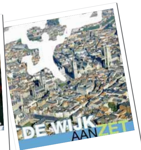
DE WIJK AAN ZET