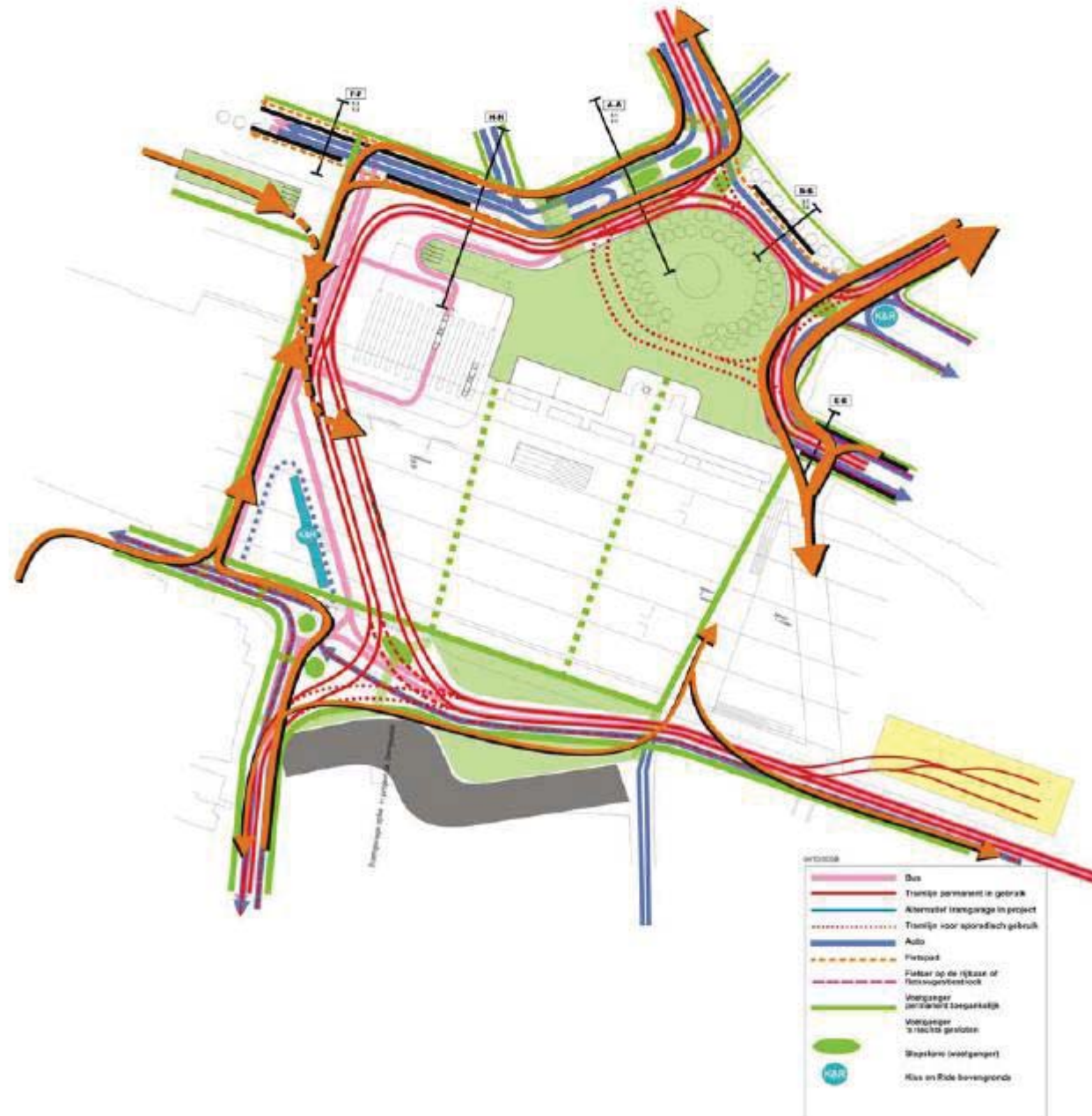
Figuur 2 fietsstromen van en naar het station Gent Sint Pieters